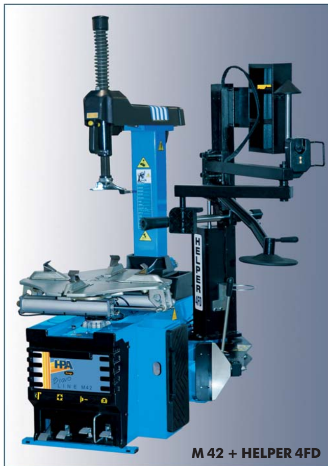
M 42 + HELPER 4FD