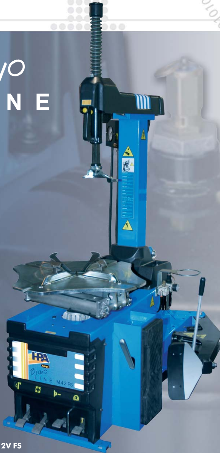
M 42 2V FS